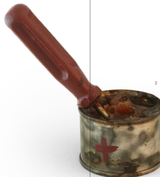
3 OBJEKT ZUM SCHMIEREN UND DREHEN [OBJEKT DO SMAROWANIA I OBRACANIA] Joseph Beuys (1921-1986) 1972, puszka pomalowana farbą olejną, smar, szubokręt VG Bild-Kunst, Bonn 2022

Artystki i artyści są stale w ruchu. Obok dynamiki zglobalizowanego rynku sztuki na ich drogi życiowe wpływają wydarzenia polityczne na świecie. W swojej twórczości odwołują się do osobistych doświadczeń i sytuacji społecznych. Obejrzyć można prace takich twórców, jak Marina Abramović, Sigmar Polke, Gerhard Richter czy Andy Warhol, oraz innych renomowanych artystów i artystek z Rosji i Polski, tutaj w większości mało znanych. Ich biografie naznaczone są doświadczeniem migracji i politycznymi przemianami na linii Wschód-Zachód. Odzwierciedlają to podejmowane tematy, jak tożsamość i wykorzenienie. W ten sposób dzieła sztuki dotykają kwestii ważnych również dla teraźniejszości Europa-Miasta Görlitz-Zgorzelec.